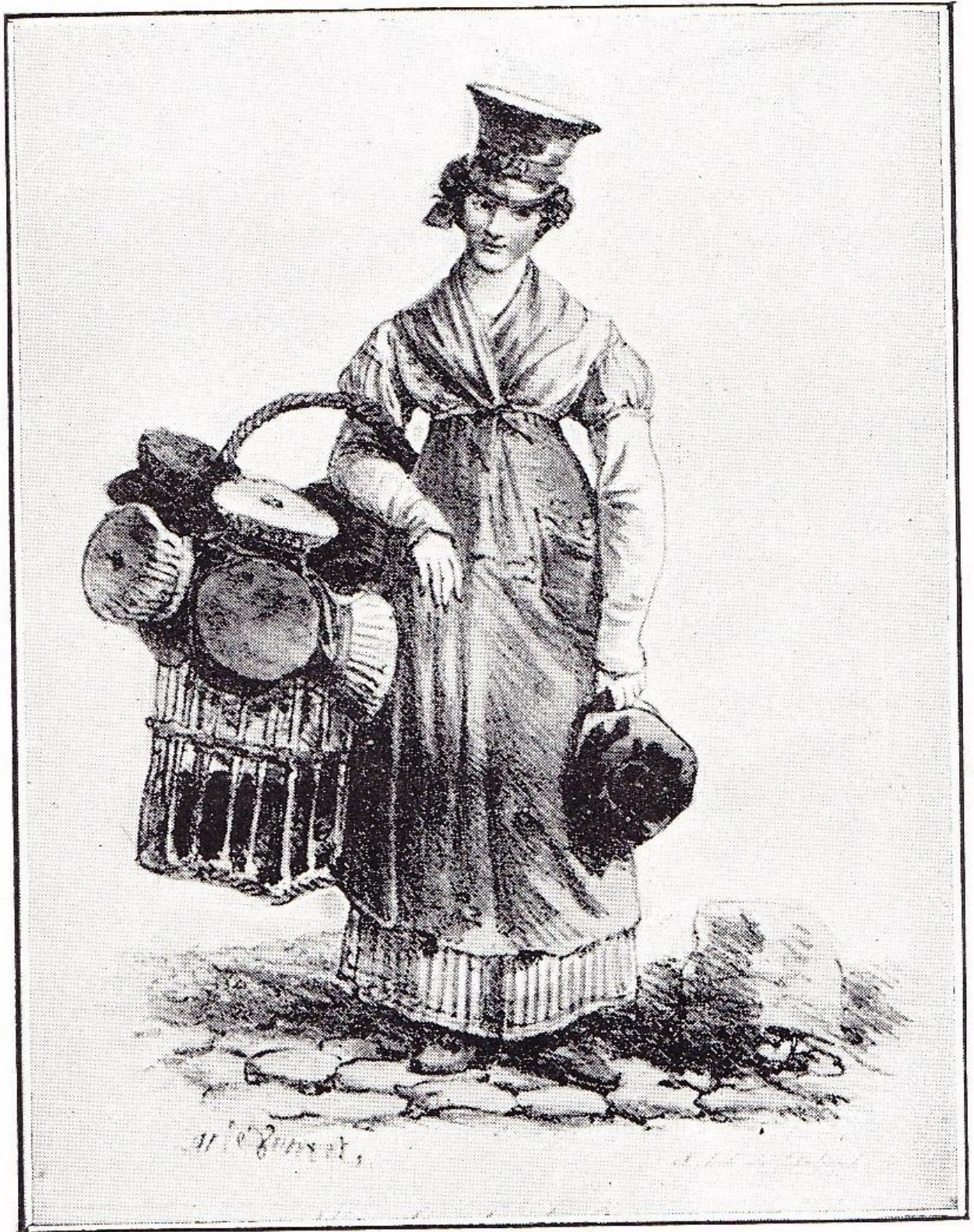
LA MARCHANDE DE CASQUETTES. D'après l'original de CARLE VERNET. (Bibliothèque de la Ville de Paris.)